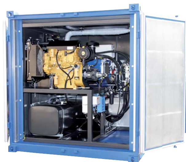
4-цилиндровый дизельный двигатель