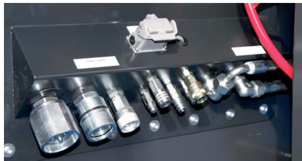
Фитинги и разъемы