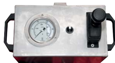
Пульт дистанционного управления